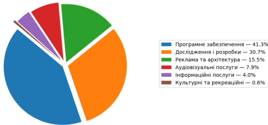
Рис. 2. Структура світового експорту креативних послуг у 2022 р., %

Подальше посилення ролі цифрових технологій простежується і на рівні окремих підсекторів креативних індустрій. Зокрема, у сегменті індустрії записаної музики, за даними IFPI, частка стрімінгових сервісів у глобальних доходах зростає з 62,1% у 2020 р. до 67,3% у 2023 р., що свідчить про домінування цифрових каналів дистрибуції у цьому сегменті [5].